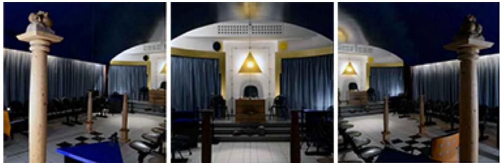
Trois vues de la salle de réunions du temple maçonnique d'Épinal.

Les conférences se tiennent 7 avenue de Provence, au temple maçonnique d'Épinal ouvert exceptionnellement au public. L'édifice a traversé quelques épisodes mouvementés depuis sa création il y a exactement 150 ans.