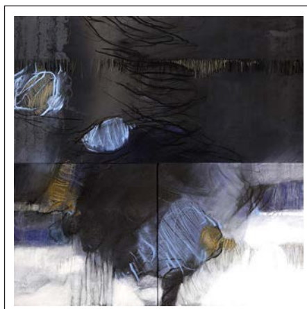
« De voile et d'espace », technique mixte sur toile et acier (collection particulière New York)