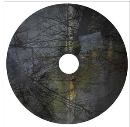
« De croisée et d'intime », technique mixte sur acier : Diam-1700 acquisition du Conseil départemental des Vosges

Ses travaux ont été présentés dans divers contextes institutionnels, culturels et spirituels, en France comme à l'étranger, notamment à la Biennale de Venise, Shan-